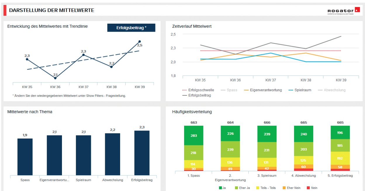
Beispiel eines Premium-Dashboards

Der Editor-Zugang beinhaltet neben den umfangreichen Möglichkeiten zur Einrichtung Ihres Dashboards im Self-Service auch die Funktionen zur Administration Ihres Accounts. Sie gestalten Ihr Dashboard hinsichtlich Umfang und Darstellungsform der Daten ganz nach Ihren Wünschen selbst und verwalten die Zugangsrechte für weitere Nutzer.